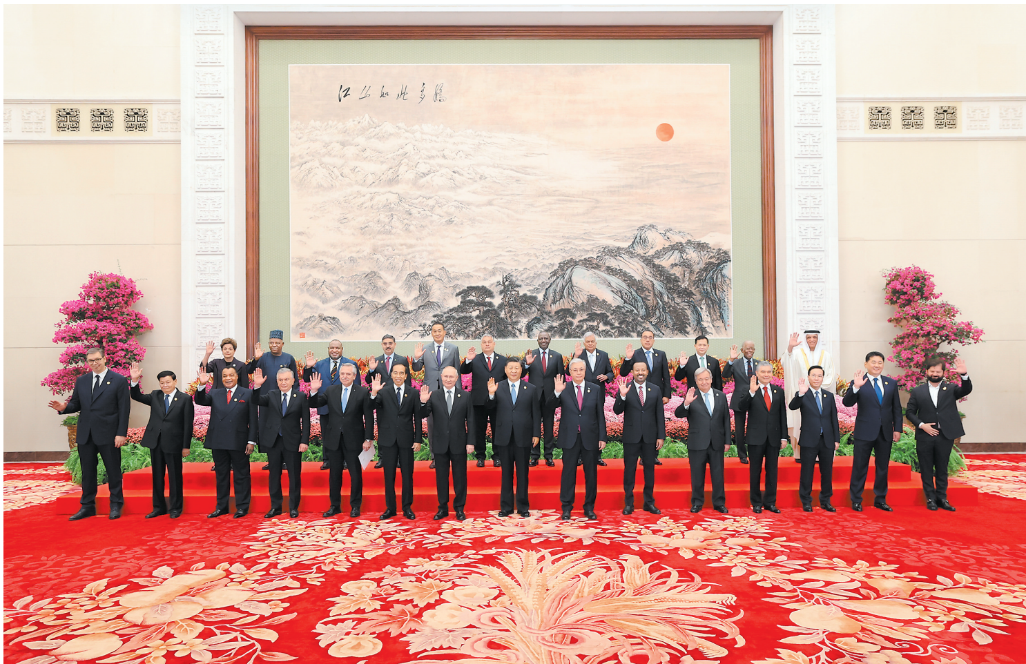
10月18日上午,国家主席习近平在北京人民大会堂出席第三届“一带一路”国际合作高峰论坛开幕式并发表题为《建设开放包容、互联互通、共同发展的世界》的主旨演讲。这是会前,习近平同出席高峰论坛的外国国家元首、政府首脑和国际组织负责人等国际贵宾集体合影。

新华社北京10月18日电(记者徐铭 孙奕)10月18日上午,国家主席习近平在人民大会堂出席第三届“一带一路”国际合作高峰论坛开幕式并发表题为《建设开放包容、互联互通、共同发展的世界》的主旨演讲。习近平宣布中国支持高质量共建“一带一路”的八项行动,强调中方愿同各方深化“一带一路”合作伙伴关系,推动共建“一带一路”进入高质量发展的新阶段,为实现世界各国的现代化作出不懈努力。 金秋时节,天高气爽,风清日朗。天安门广场上,共建“一带一路”国家国旗迎风飘扬,相映成辉。 出席高峰论坛的外国国家元首、政府首脑和国际组织负责人等贵宾陆续抵达。人民大会堂东门大厅两侧大屏幕上,共建“一带一路”项目十年硕果累累。 习近平同出席开幕式的外方领导人集体合影。 在《和平-命运共同体》乐曲中,习近平同外方领导人一同步入会场。全场起立热烈欢呼。 习近平发表题为《建设开放包容、互联互通、共同发展的世界》的主旨演讲。 习近平指出,今年是我提出共建“一带一路”倡议10周年。提出这一倡议的初心,是借鉴古丝绸之路,以互联互通为