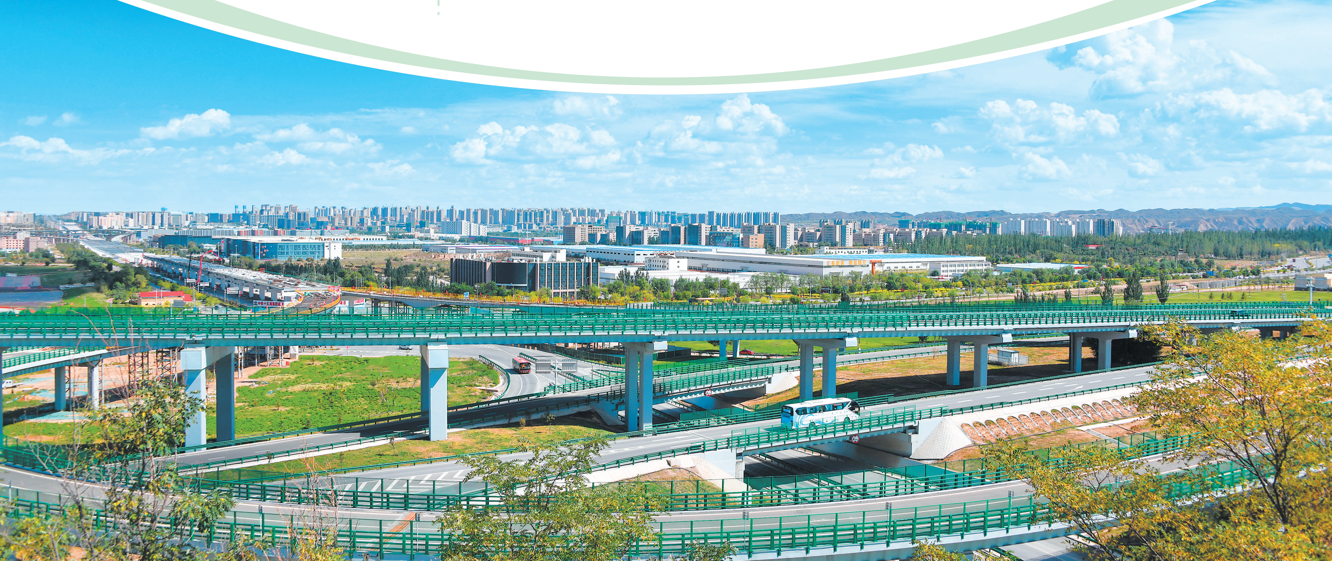
兰州中川机场T3航站楼连接立交。