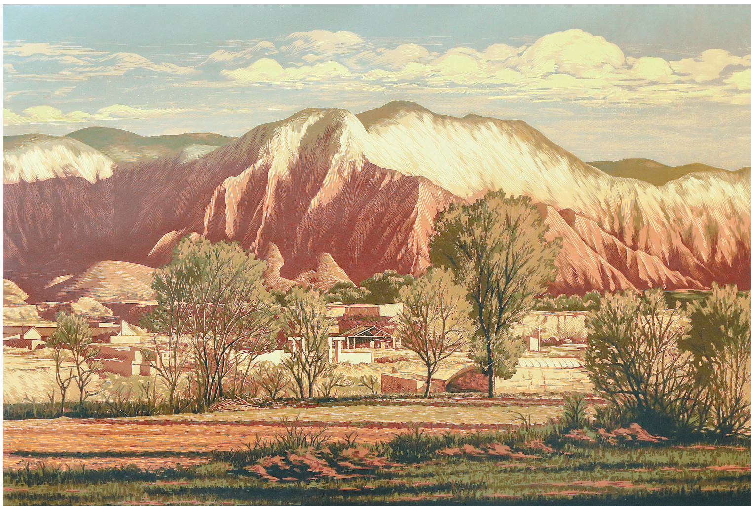
故乡的记忆(版画) 梁进宝