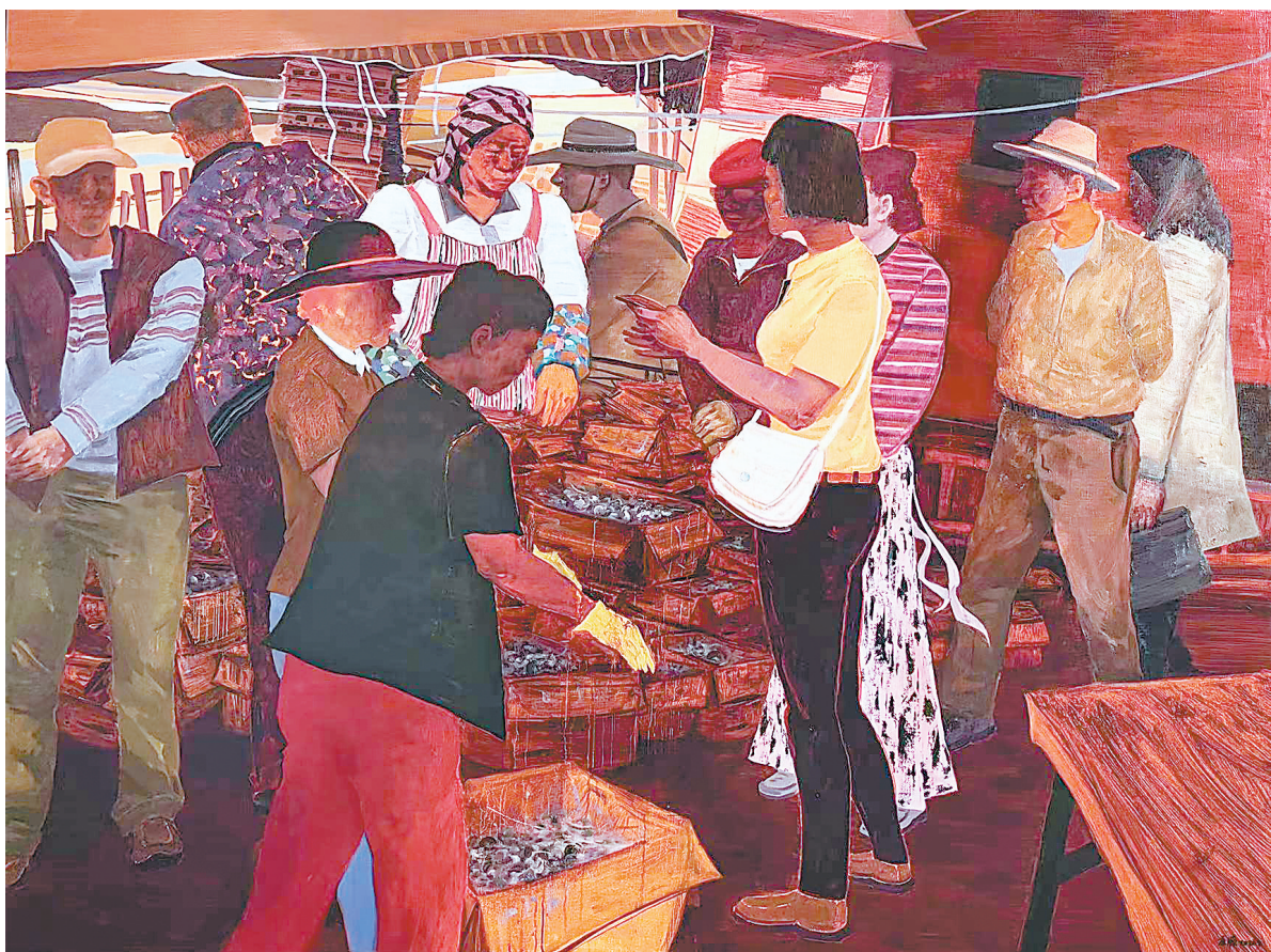
市井百态(油画) 李源