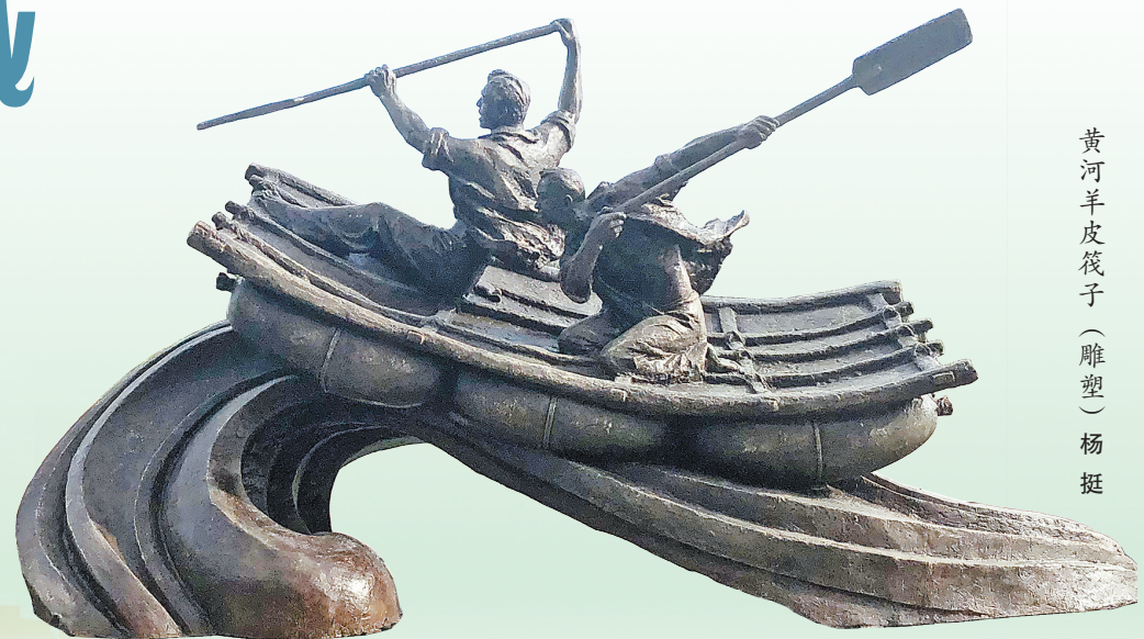
黄河羊皮筏子(雕塑) 杨挺

白银——中国唯一以贵金属命名的城市、丝绸之路的重要节点之一，黄河文化、红色文化、丝路文化、工矿文化在这里交融。让我们跟随丹青妙笔走进白银，感受多彩铜城的隽永魅力，欣赏绿水青山环绕、蓝天白云相映的美丽画卷。