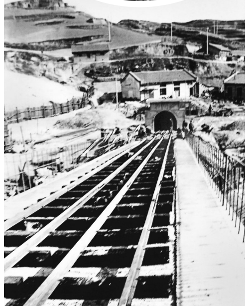
杨家沟煤矿井口。