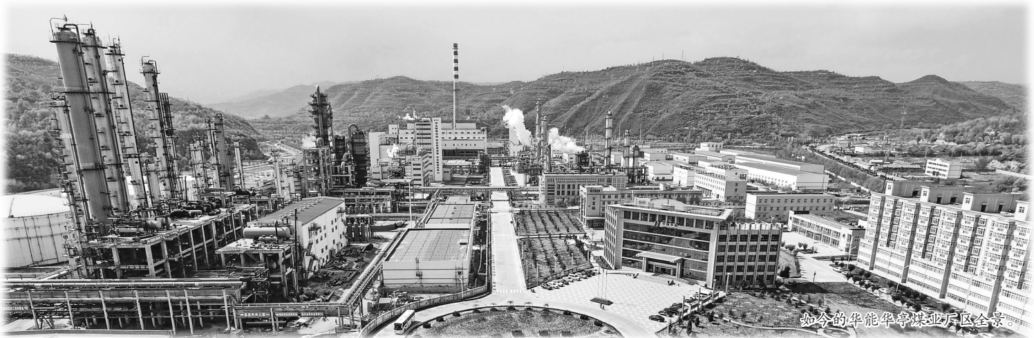
如今的华能华亭煤业厂区全景。