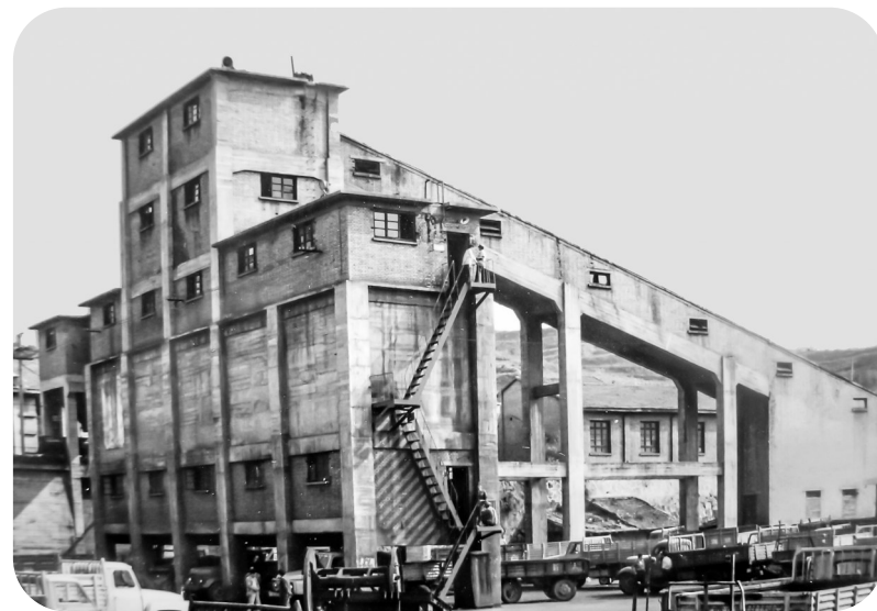
20世纪90年代安口煤矿选煤楼。