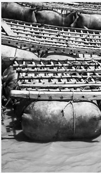
黄河里的羊皮筏子