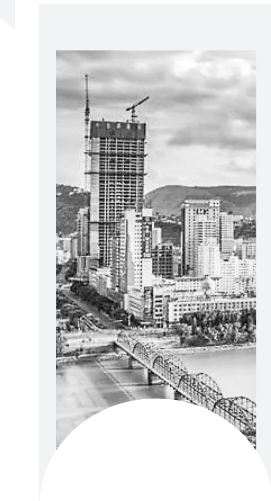
从白塔山俯拍黄河和中山铁桥

皮筏，《汉语词典》里的解释很简单，就是用牛羊皮缝制而成的筏子，一种黄河上游地区的特殊交通工具。