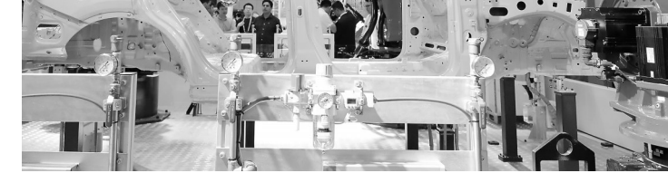
9月19日,参观者在一组进行车身焊接演示的机器人前驻足观看。当日,第二十三届中国国际工业博览会在国家会展中心(上海)开幕。

国家防总办公室同时向相关省份防汛抗旱指挥部和长江、淮河防汛抗旱总指挥部发出通知,要求以毫不松懈的劲头持续抓好暴雨洪涝灾害应对工作,密切监视强降雨过程,滚动会商研判调度,重点做好山洪地质灾害防御、中小河流洪水防范、中小水库安全度汛和城乡内涝应急处置等工作,全力保障人民群众生命财产安全。