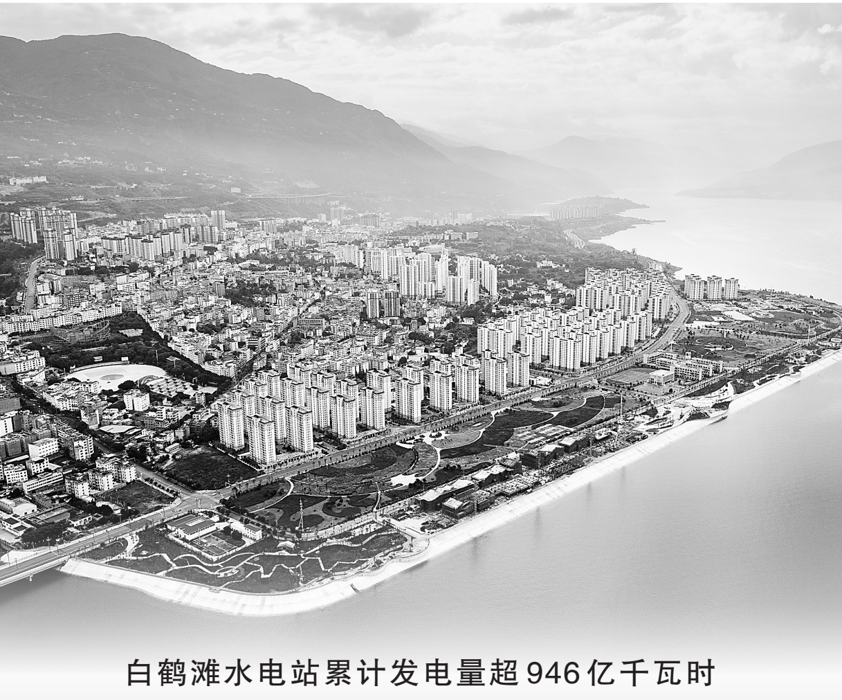
这是9月18日拍摄的位于白鹤滩水电站库区的巧家县城。白鹤滩水电站位于云南省巧家县和四川省宁南县交界处金沙江干流河段,是仅次于三峡电站的世界第二大水电站,总装机容量1600万千瓦。截至9月17日,白鹤滩水电站累计发电量超946亿千瓦时。