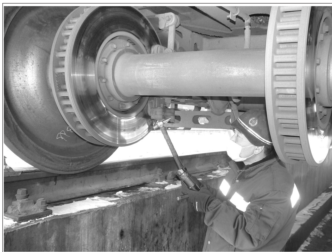
兰州车辆段坚持从严要求,从严落实,做好运用列车的检查、维修、盯控,严把车辆设备、设施检修质量关,确保春运期间动车组设备性能良好、安全稳定。图为该段兰州库检车间职工在检查K9668次轮对刹车盘。