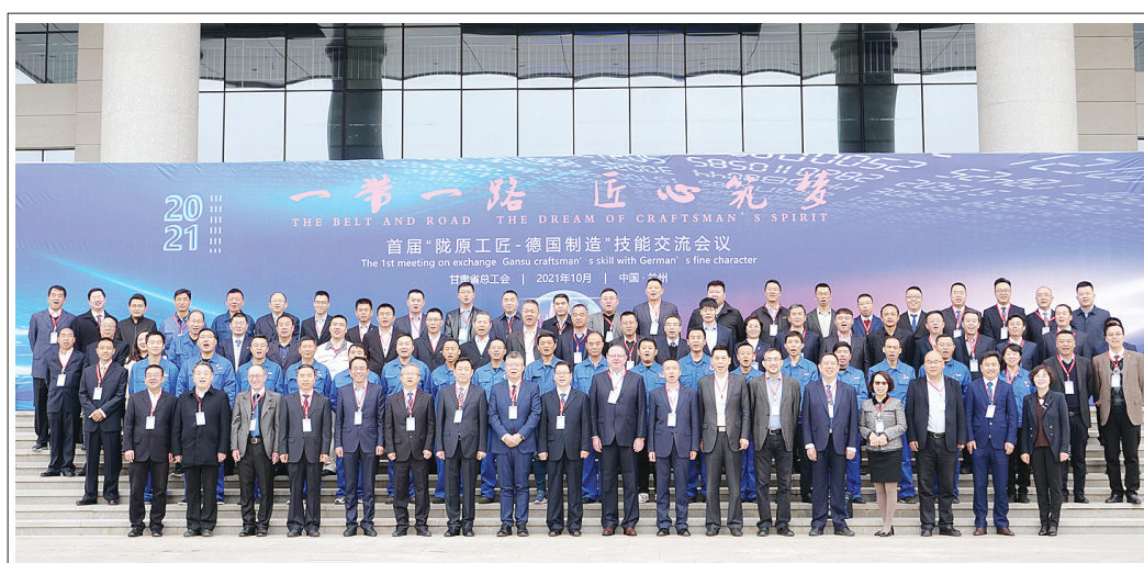
参会代表合影留念