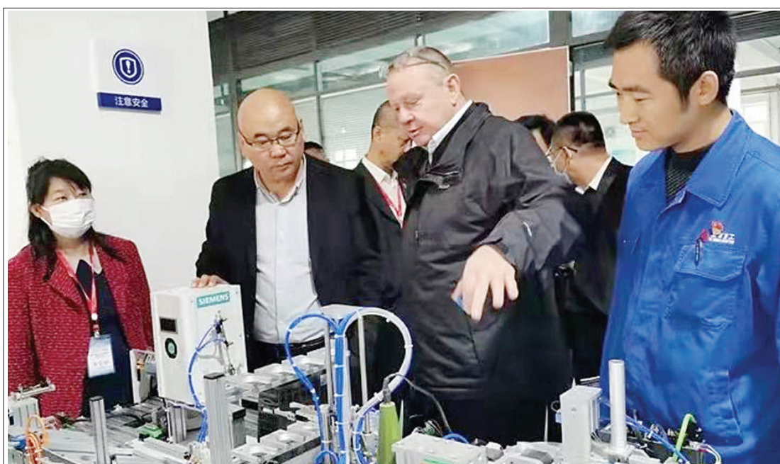
与会代表参观兰州职教园区,与园区院校机械制造业、数控专业、焊接专业师生进行交流,探讨实习实训及进修合作空间。