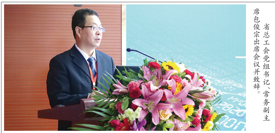
省总工会党组书记、常务副主席席包俊宗出席会议并致辞。

此次会议是落实我省产业工人队伍建设改革的一项重要举措,也是弘扬宣传劳模精神、劳动精神、工匠精神的具体体现。会议旨在从德国制造、职业教育、人才培养的经验中探寻甘肃省职业教育、产业工人培养的新路子,挖掘甘肃产业工人队伍建设改革与德国制造、职业教育人才培养等方面的结合点,助力甘肃产业工人队伍建设。