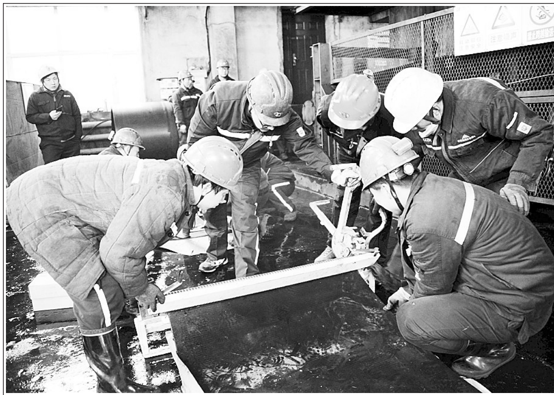
连日来,中国华能华亭煤业集团公司东峡煤矿停产对全矿所有机电设备进行“体检”,并且制定了严密的年底检修项目、措施和工作要求,全力做好年末设备检修工作。图为员工在地面转载机房更换煤流运输股带。

本报讯 据从省发改委获悉,为进一步推进全省以工代赈工作,扩大以工代赈投资建设领域和实施范围,经省政府同意,该委制定印发了《甘肃省在农业农村基建领域积极推广以工代赈方式的意见》。 《意见》指出,全省各地要深刻认识推广以工代赈方式在改善乡村生产生活条件、补齐“三农”短板、推进乡村振兴中的重要作用,以及在提升农民技能、拓展农村就业空间、激发低收入人口内生动力方面的特殊作用,结合以工代赈项目投资规模小、技术门槛低、前期工作简单、务工技能要求不高的特点,选择一批农村生产生活、交通水利、文化旅游、林业草原等基础设施建设项目,积极推广以工代赈方式,为巩固拓展脱贫攻坚成果、有效衔接乡村振兴战略发挥积极作用。大力拓展以工代赈建设领域和实施范围,因地制宜确定适合采取以工代赈方式实施的项目,多渠道扩大以工代赈实施规模。同时,要统筹考虑采用以工代赈方式组织实施项目建设,认真做好组织农村劳动力参与工程建设、及时足额发放劳务报酬、技能培训和公益岗位设置等工作,充分发挥帮助农民群众实现就近就业增收、促进扶贫同扶志扶智相结合、激发内生动力中的重要作用。(宗和)