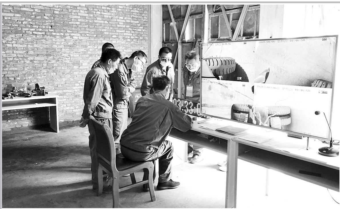
8月6日,肃南县总工会举办祁青工业园区矿山专用车辆驾驶技能大赛,为职工的成长成才搭建了良好平台,为企业发掘和培养实用型、复合型人才开辟了快速通道,为推动全县职工职业技能比赛起到示范引领和辐射带动作用。王强卓玛 摄

目前,涉案嫌疑人已被采取刑事强制措施分批押解回兰,案件正在进一步侦办中。(宗和)