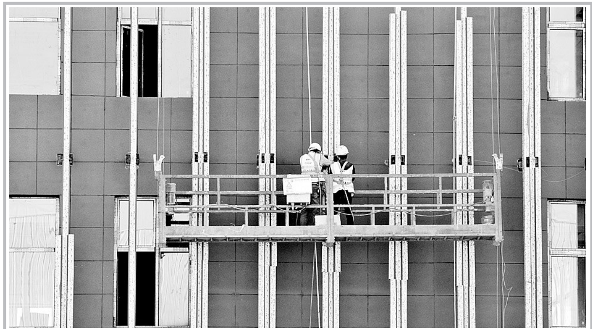
由中铁二十局市政公司承建的西北地区最大金融仓储基地——甘肃航旅金融仓储基地(一期)工程装修进入尾声。该项目地处兰州新区,分一、二期建设,总建筑面积27万平方米,一期工程将于5月底全面完工,2021年6月全部建成后提升兰州新区在“一带一路”的区位优势,为西北地区物流、工矿、商贸等企业提供全程供应链服务。图为工人正在进行服务楼外墙铝方通造型施工。

本报讯 据近日从兰州市人社局了解到,为帮助初创企业渡难关,兰州市人社局各级创业孵化示范基地(园区)加大对在孵企业房租等费用的减免力度,预计将为1776家人孵企业减免各类费用2732万元。据了解,省、市两级创业孵化示范基地通过减免场地租金、物业、水电费等费用,免费提供线上培训、企业咨询等各类服务,帮助在孵的中小企业排忧解难,预计将为1776家人孵企业减免各类费用2732万元。其中,兰州高新区创业服务中心在孵的132家企业减免2月至4月的各类费用,预计减免678万元;西部创客在孵企业免除2月份租金,3、4月份租金减半,其他各类费用全免,预计减免438万元。据悉,截至3月9日,全市43家市级孵化基地已有40家复工复产,帮助1067家在孵企业实现复产,复产率达到39.08%;带动6894名员工复工,复工返岗率40.5%。(宗和)