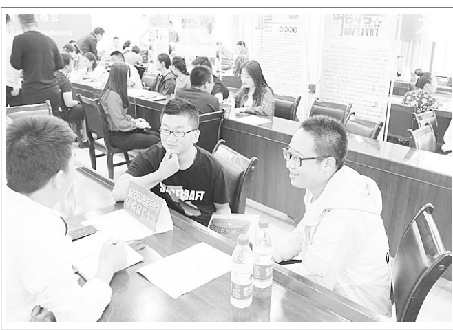
近日,肃南人社局举办了“引导普通高校高校毕业生到县内企业服务专项招聘会”,该局对接县内32家企业,提供就业岗位45个,当日签订就业协议36人。活动当天,有150余名高校毕业生参加了招聘会。图为招聘会现场。