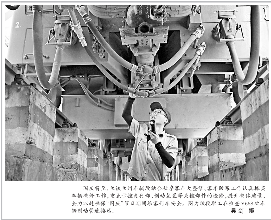
国庆将至,兰铁兰州车辆段结合秋季客车大检修、客车防寒工作认真抓实车辆检修工作,重点卡控走行部、制动装置等关键部件的检修,提升整体质量,全力以优确保“国庆”节日期间旅客列车安全。图为该段职工在检查Y668次车辆制动管连接器。