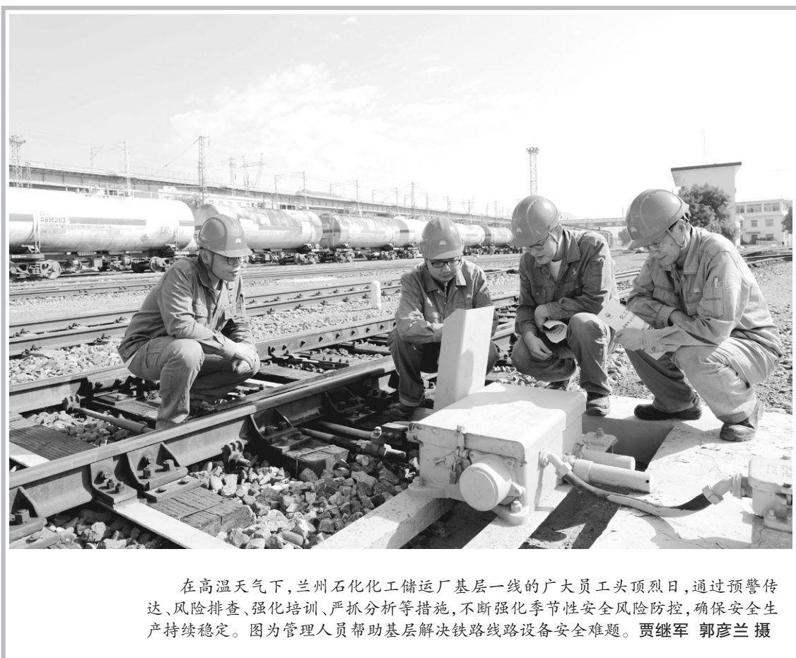
在高温天气下,兰州石化化工储运厂基层一线的广大员工头顶烈日,通过预警传达、风险评估、强化培训、严抓分析等措施,不断强化季节性安全风险防控,确保安全生产持续稳定。图为管理人员帮助基层解决铁路线路设备安全难题。

同时,七彩丹霞景区还采取分流减压措施,推出深度游、舒享游、热气球自由飞、乘观光车等体验性项目,通过体验性项目向景区人流较少区域引流;严格执行“一张门票游两天”景区优惠政策,满足游客次日需求,缓解景区内运营压力;充分利用大数据平台科学研判,高效调度人力、物力及设施设备,确保景区内秩序井然,让游客玩得开心舒心。