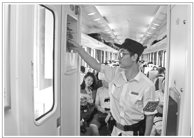
入夏以来,兰铁兰州车辆段围绕电气设备检查、防燃防切、防火安全等重点,强化车辆乘务员途中巡视检查工作,卡控车辆安全关键,切实消除影响车辆安全的关键性隐患,全力确保暑运期间旅客运输安全。图为该段T6608车辆乘务员途中车内巡视检查。