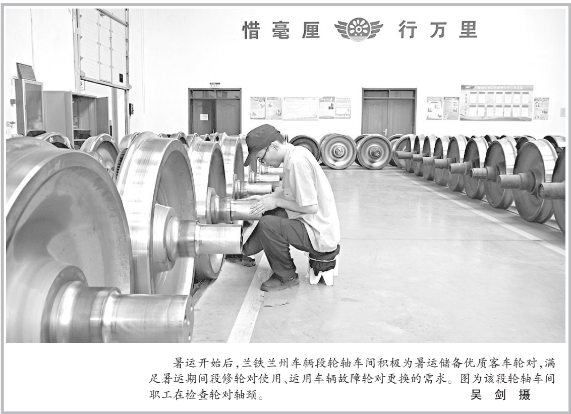
暑运开始后,兰铁兰州车辆段轮轴车间积极为暑运储备优质客车车轮,满足暑运期间段修轮对使用、运用车辆故障轮对更换的需求。图为该段轮轴车间职工在检查轮对轴颈。

另外,兰州市水务局防汛办将加强对水情的监测预警工作,加大对上游水电站防汛调度工作的监管,保证黄河水位平稳下泄。市水务局防汛办表示,根据黄河水利委员会调度指令目前上游电站水库已经调减下泄流量。