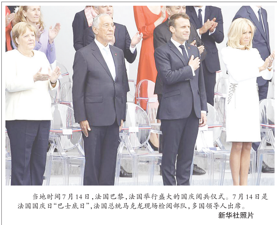
当地时间7月14日,法国巴黎,法国举行盛大的国庆阅兵仪式。7月14日是法国国庆日“巴士底日”,法国总统马克龙现场检阅部队,多国领导人出席。

英国《卫报》援引民主党战略专家施勒姆的话称,特朗普没有自己的执政理念,所以他唯一的原则就是搞砸奥巴马的成绩,他对奥巴马的恨成为其前进的动力。伊朗核协议被视为奥巴马任内的重大外交成绩,但特朗普去年5月无视盟友反对,退出伊核协议并恢复对伊朗制裁,还称伊核协议是灾难性的、最糟糕的协议。他在2016年竞选时誓言,上任后第一件事就是退出伊核协议,所以约翰逊