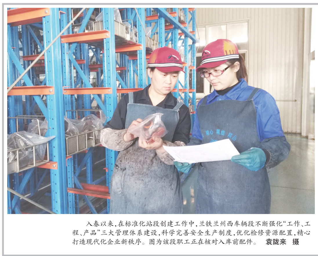
入春以来,在标准化站段创建工作中,兰铁兰州西车辆段不断强化“工作、工程、产品”三大管理体系建设,科学完善安全生产制度,优化检修资源配置,精心打造现代化企业新秩序。图为该段职工正在核对入库前配件。

王江平强调,2019年将扎实推进危化品生产企业搬迁改造,着力做好六方面工作:一是要不断提升对危化品搬迁改造工作重要性和紧迫性的认识;二是加强统筹协调,提高工作效率;三是加大重点地区和重点项目的协调;四是加大要素供给,执法推动和政策优化力度;五是加强搬迁改造工作中的安全环保管理;六是积极营造良好的氛围。