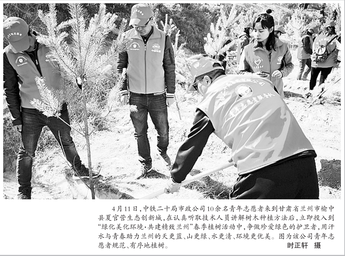
4月11日,中铁二十局市政公司10余名青年志愿者来到甘肃省兰州市榆中县夏官营生态新城,在认真听取技术人员讲解树木种植方法后,立即投入到“绿化美化环境·共建精致兰州”春季植树活动中,争做珍爱绿色的护卫者,用汗水与青春助力兰州的天更蓝、山更绿、水更清、环境更优美。图为该公司青年志愿者规范、有序地植树。

困难帮扶扎实有效。元旦春节期间,慰问全国劳模、省部级困难劳模、困难职工家庭、工亡、工残职工家庭等共计1473户,发放慰问金199.4万元。做好金秋助学活动,发放助学金8.4万元。进一步完善职工帮扶互助金保障机制,全年职工互助金161万元。“爱心捐助月”职工自愿捐款39万元。截至2018年10月,累计帮扶救助185人次,发放互助金167万元。(李延山)