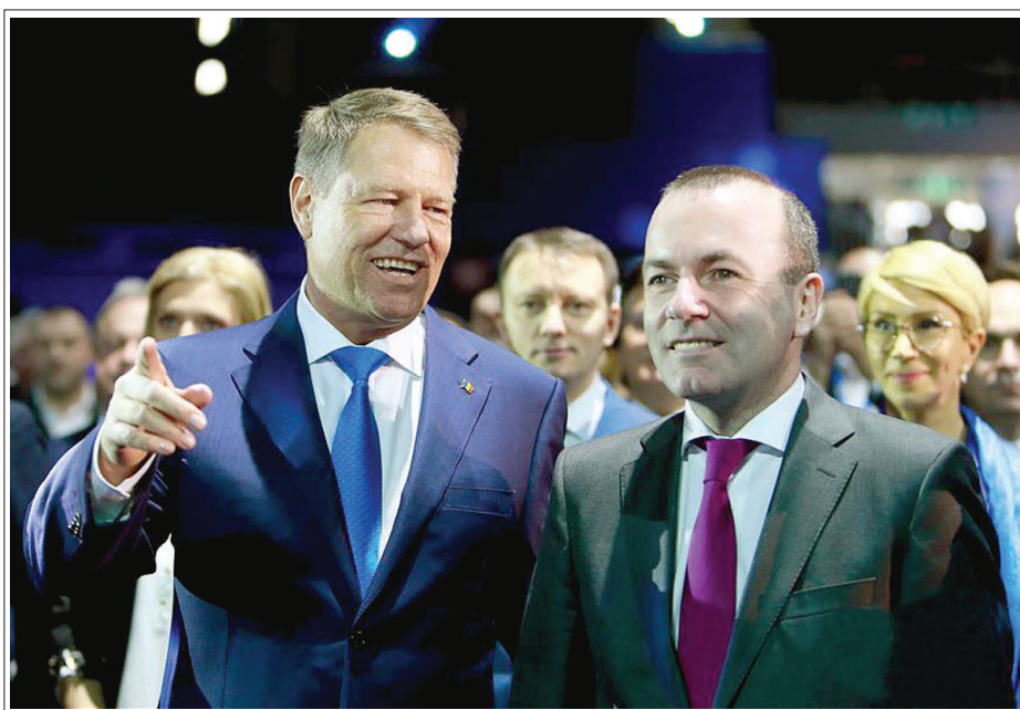
3月16日,在罗马尼亚首都布加勒斯特,罗马尼亚总统约翰尼斯(左)与欧洲人民党在欧洲议会的党团领袖、该党欧盟委员会主席候选人曼弗雷德·韦伯(前右)交谈。欧洲议会最大党团欧洲人民党16日在罗马尼亚首都布加勒斯特举行地区和地方领导人会议,为将于今年5月举行的欧洲议会选举做准备。

一座城市达丁的场地的规模同样不小。 分析人士指出,尽管目前没有证据表明,犯罪分子的用枪跟“枪城”有直接关联,但这无疑为潜在犯罪分子提供了犯罪温床。 社交媒体角色引反思 社交媒体平台在这起惨案发酵过程中暴露出的问题也引发各界反思。 主要嫌犯塔兰特通过脸书账号直播行凶过程。在脸书接获警方要求删除其账号和视频之前,直播已进行了十几分钟。而在行凶当天,塔兰特还通过推特账号发布一篇长文,宣扬白人至上主义的极端思想。 《新西兰先驱报》指出,“这是首次着眼于社交媒体(传播)的袭击”,并认为人们对社交媒体在此类事件中扮演的角色已“忍无可忍”。 新西兰前总理海伦·克拉克告诉当地电视台,社交媒体平台在移除仇恨言论等内容方面反应迟缓,居然能让枪手直播了17分钟。她认为此事将在全球激发更多要求有效监管社交媒体的呼声。 英国内政大臣贾维德则在个人推特上提到脸书、推特、优兔等,呼吁社交媒体平台采取更多行动,阻止暴力极端思想借此平台扩散。 事件带来多重影响 分析人士认为,这起恐袭事件给向来以安全著称的新西兰带来一系列影响。