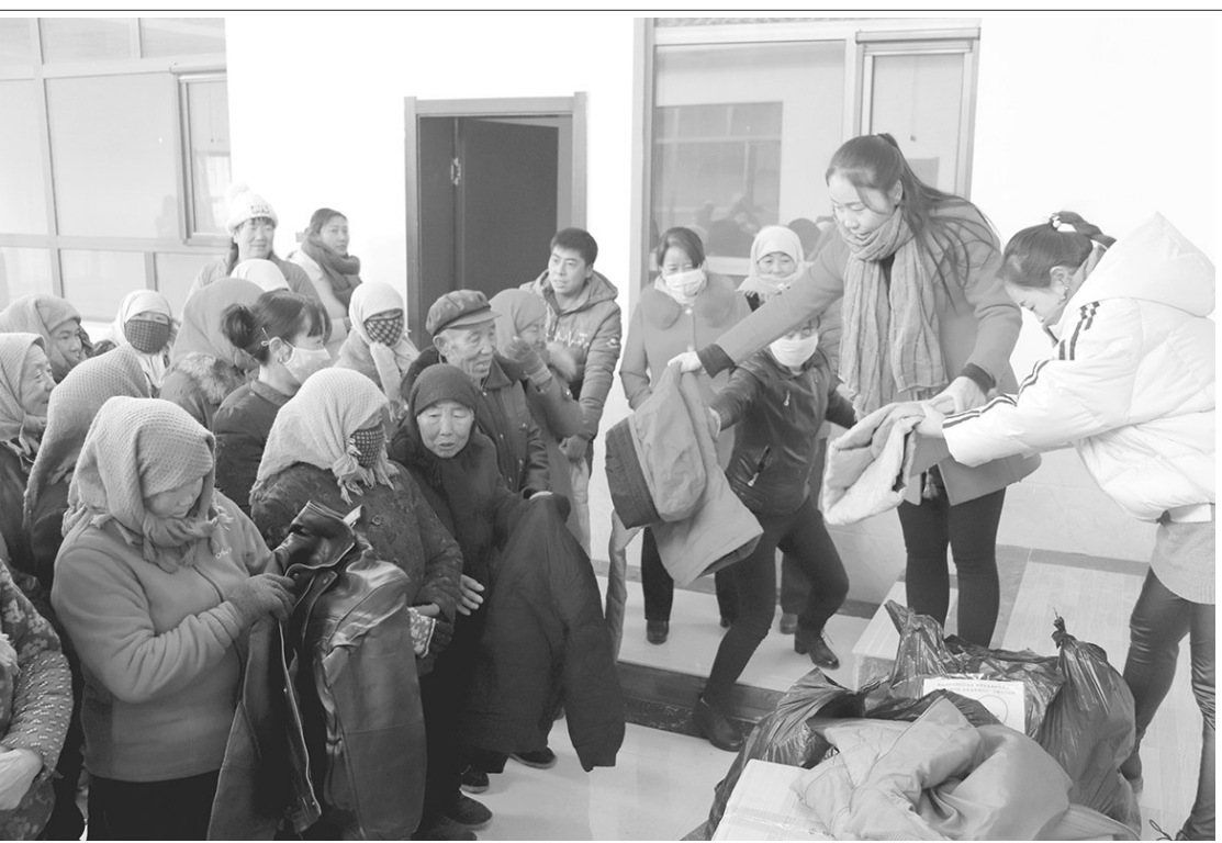
近日,瓜州县渊泉镇邮电巷社区党员、爱心商户、五色服务志愿者代表,迎着凛冽寒风来到结对帮扶的梁湖乡双州村,开展了“扶贫帮困解民忧 浓浓真情暖民心”主题党日活动,为困难群众送去了300余件棉衣、棉被等物品,帮助困难群众温暖过冬。

他常常说“日行行,不怕千万里;常常做,不怕千万事”,曾被评为“感动兰铁十大人物”的他把满腔热血奉献给了铁路,用热心、匠心、爱心谱写了货场的安全运输和职工的幸福生活。