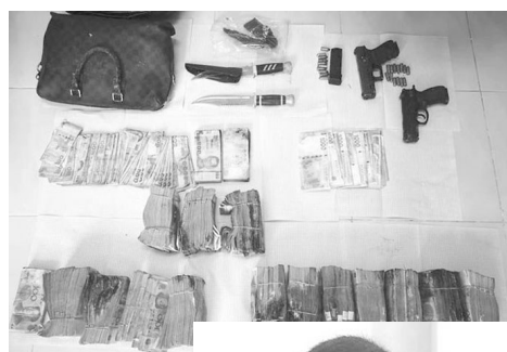
▲警方缴获的赃款和作案凶器