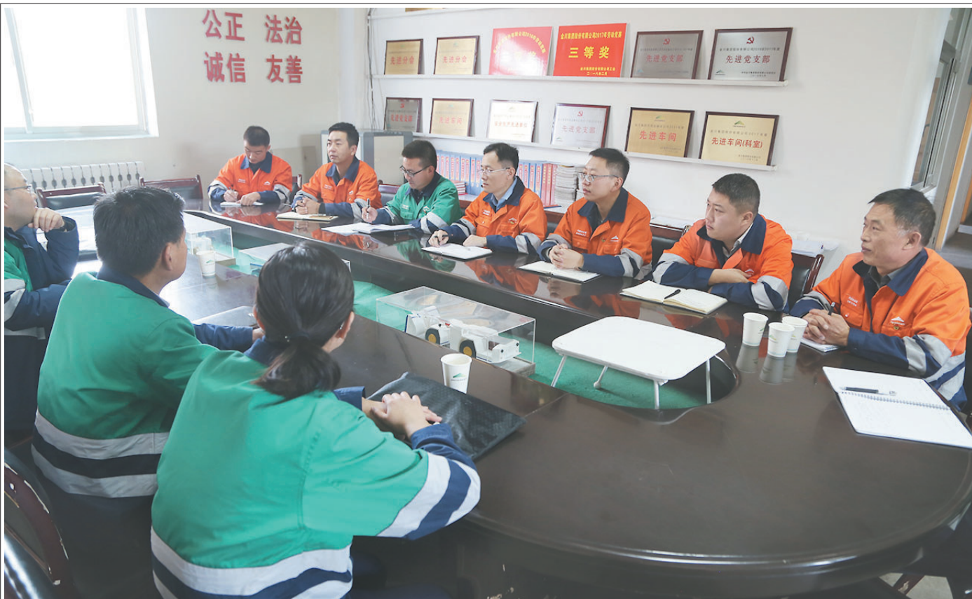
近日,金川集团汽运分公司党政工组织一线分会和班组职工认真学习中国工会十七大精神。车队、车间分会通过排班会、调度会、专题会,学习宣传贯彻中国工会十七大精神,表示要立足新起点,把握新时代,争做“陇原工匠”“金川劳模”,为企业展现新气象、实现新作为再立新功。