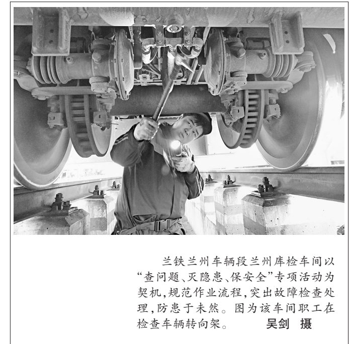
兰铁兰州车辆段兰州库检车间以“查问题、灭隐患、保安全”专项活动为契机,规范作业流程,突出故障隐患排查处理,防患于未然。图为该车车间工人在检查车辆转向架。

通过开展党支部建设标准化工作,白银有色集团选矿公司各党支部党建基础得到夯实,为进一步发挥党支部的创造力、凝聚力、战斗力,提高服务水平打下了良好基础,切实把党的政治优势、组织优势、群众工作优势转化为做好各项工作的强大动力,转化为推进中心工作的坚强保证。(薛磊)