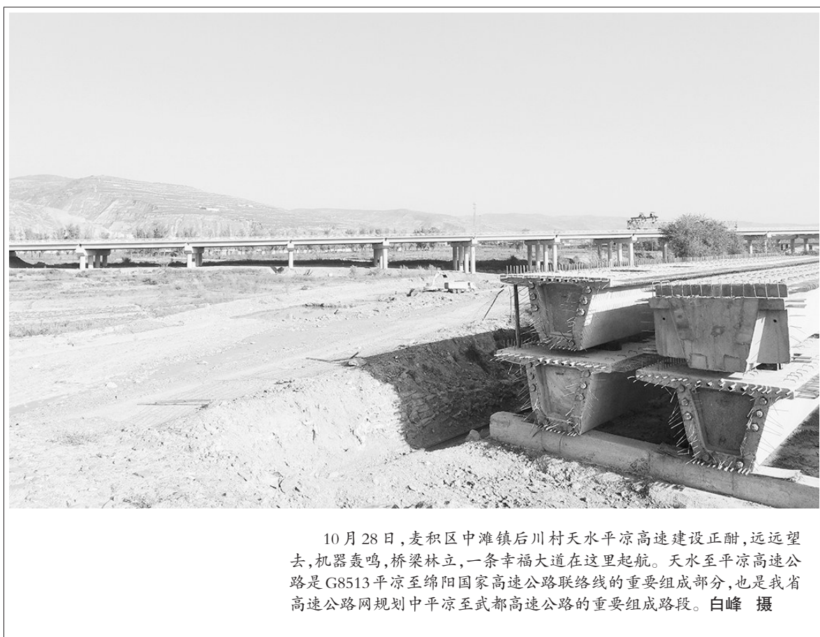
10月28日,麦积区中滩镇后川村天水水平凉高速建设正酣,远远望去,机器轰鸣,桥梁林立,一条幸福大道在这里起航。天水至平凉高速公路是G8513平凉至绵阳国家高速公路联络线的重要组成部分,也是我省高速公路网规划中平凉至武都高速公路的重要组成部分。

一是加强冬季公路养护,做好今冬明春防滑工作,利用天气良好的有利时机,早部署、早动手,积极采备公路防滑材料,在急弯、陡坡、连续下坡、隧道出入口等重点路段储备足量防滑料,确保恶劣天气下及时应对突发事件。二是全面排查公路桥梁病害,完善冬季恶劣天气应急预案,及时备足防滑料和除雪防滑物资,提前做好车辆的保养、维修及后勤保障工作,随时做好突发事件的应急响应,确保各类路况安全畅通。三是加强桥梁日常养护管理,重点抓好路面、桥涵障碍物清理,及时清除伸缩缝、泄水孔及桥面杂物,加强桥梁结构维护保养,及时处理病害和各类安全隐患,确保公路桥梁安全运行。四是严格落实安全生产分析例会等制度,认真分析安全生产工作中的重点,研究制定安全管理措施,加强对公路养护作业现场、施工现场、办公重点区域、料场等的安全隐患排查治理。五是对隐患排查出的料场和工区(养管站)大型设备设施的安全警示牌、安全操作规程陈旧、风险告知牌不齐全,机械设备作业区未隔离等问题,及时新增更换安全警示牌,安全操作规程提示板,增设机械设备安全作业牌,从源头消除安全隐患。(龙世韩 杨建平)