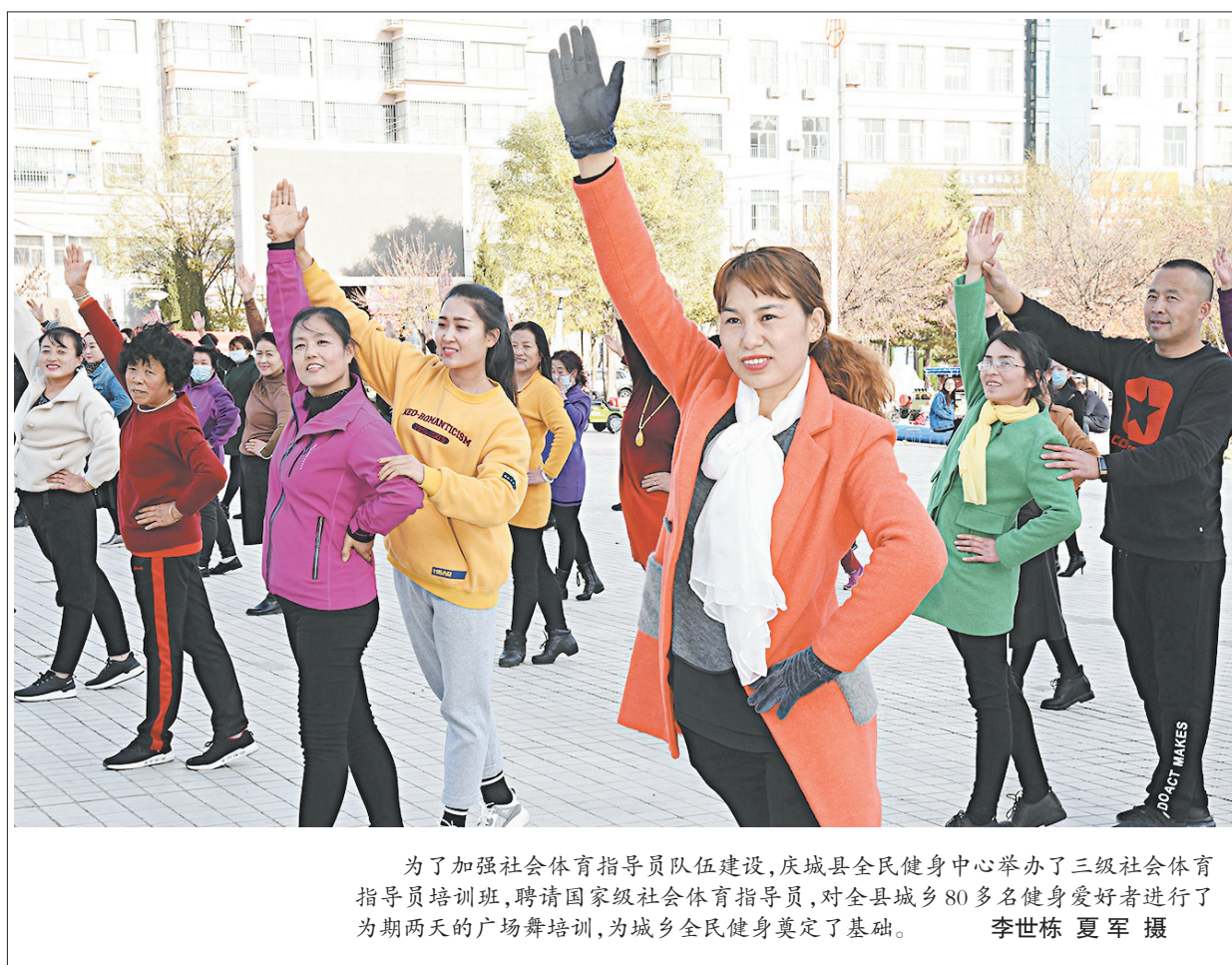
为了加强社会体育指导员队伍建设,庆城县全民健身中心举办了三级社会体育指导员培训班,聘请国家级社会体育指导员,对全县城乡80多名健身爱好者进行了为期两天的广场舞培训,为城乡全民健身奠定了基础。

工会作为广大职工的“娘家”,始终牵挂着工作在一线的职工。活动中,县总工会领导将生活用品送到了环卫工人手中,并详细了解了环卫工人的作息、清扫地点等基本工作情况,向坚守在一线岗位的环卫工人代表们表示感谢和敬意,叮嘱他们工作时注意防寒保暖,留意交通安全,确保身心健康。同时,积极引导社会各界和广大群众支持环卫事业发展,尊重环卫工人、自觉维护城市形象的良好风尚。(田玉琴 汪静)