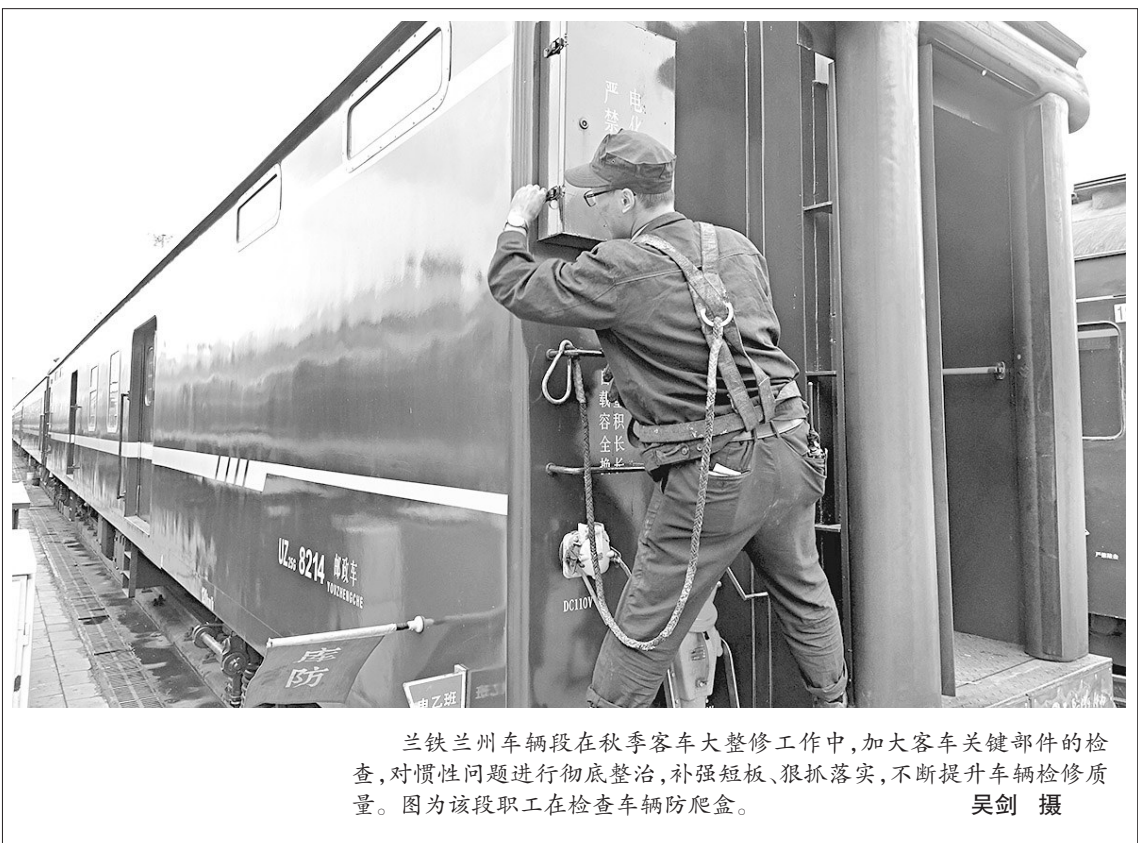
兰铁兰州车辆段在秋季客车大整修工作中,加大客车关键部件的检查,对惯性问题进行彻底整治,补强短板、根除隐患,不断提升车辆检修质量。图为该段职工在检查车辆爬盒。

一是推行“客户代表负责制”,以开展“解放思想、转变观念”为契机,各营业窗口人员对来电或来人咨询、办理业务的第一名员工,在听取客户需求后,由该员工全程为客户答复及办理用电业务手续,切实让群众感受到“门好进、脸好看、话好听、事好办”的良好氛围;二是在业务办理上建立“一条龙”服务机制,推行“一站式”服务,流程环节由“串联式”改为“并联式”,实现业务办理一步到位,切实让群众感受到“最多跑一次”的服务效能;三是开通电话、短信服务热线,通过电话、信息短信形式对客户进行电话预约或提醒,对服务进行跟踪回访,切实让群众感受到“零跑腿”优质服务的便捷;四是提供“8小时之外延伸”服务。成立电力抢修“共产党员服务队”“青年志愿者先锋队”,8小时之外无偿为居民区内孤寡老人、残疾家庭等特殊供电用户处理日常电力小故障,为客户提供“零距离”服务,切实让客户感受到“零距离服务送上门”的贴心服务。(蒋霞 李利民)