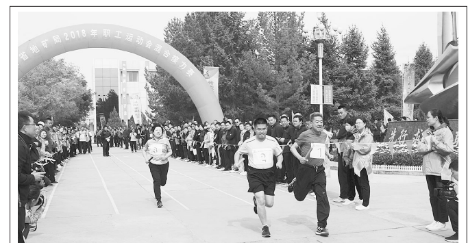
9月11日至14日,甘肃省地矿局2018年职工运动会在酒泉圆满结束。来自该局下属16个单位和酒泉市国土资源局等17支代表队,328名运动员参加了篮球、排球、乒乓球等6个大项10个小组的比赛。图为比赛现场。曾强红 摄

对此,今年3月,兰州市城管委开展了全市流浪犬集中捕捉整治月活动,5月城关区又对全市的流浪犬进行全面捕捉。据兰州市城市管理委员会基建处相关负责人介绍,截至今年8月底,犬只留检所的犬只已过5124只,目前已领养300多只,并对领养犬进行办证登记。