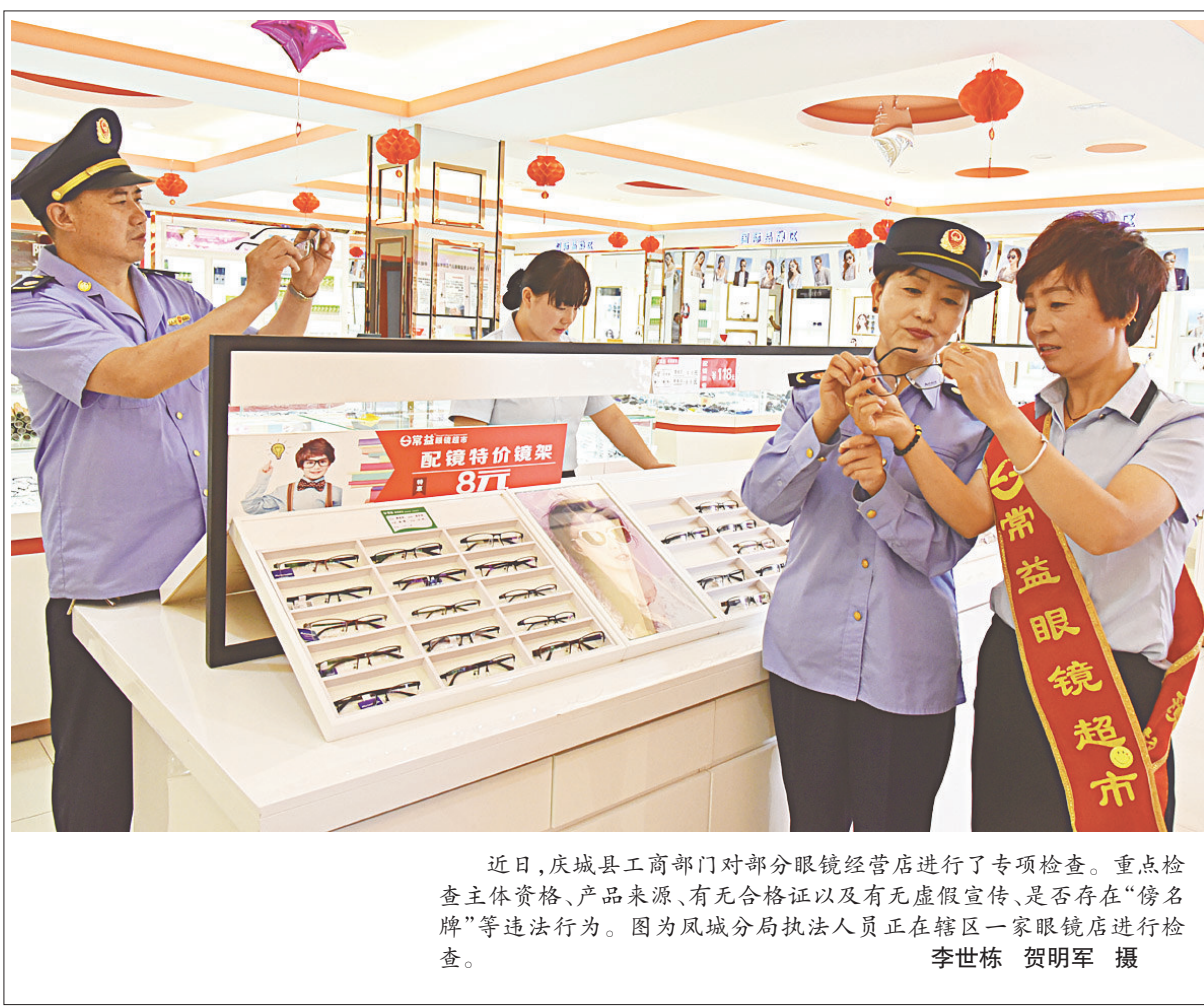
近日，庆城县工商部门对部分眼镜经营店进行了专项检查。重点检查主体资格、产品来源、有无合格证以及有无虚假宣传、是否存在“傍名牌”等违法行为。图为凤城分局执法人员正在辖区一家眼镜店进行检查。