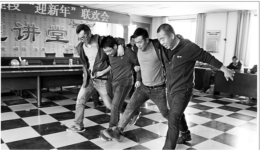
2018年新年,民乐公路管理段结合职工冬训和冬季养护工作实际,组织开展了“迎新年”联欢会,进行了单人项目和集体趣味性系列文体活动。活动项目主要包括乒乓球、台球、扑克牌、跳绳、拔河、踩气球、摸石过河、绑腿跑、顶气球等13项比赛。一个个既有益于职工身心健康,又集娱乐性、广泛性和趣味性于一体的文化娱乐活动,使每位职工都能积极参与其中。

一件小小精巧的袖珍木壶艺术品,看似简单平静,细想深究,却含有丰富多彩的文化内涵、高超的传统手工艺制作技艺、大胆奇特的布局构思,千姿百态的艺术造型,是中国传统工艺美术产品中一颗新颖奇葩。